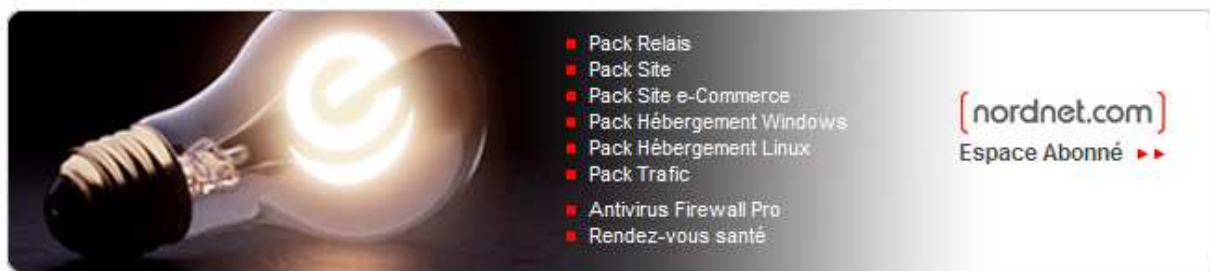
Figure 2 : Espace Abonné NordNet.com

Etape 3 : Ensuite, cliquez sur le lien "Espace Abonné" dans la partie nordnet.com.