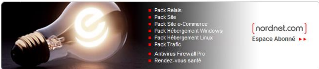
Figure 2 : Espace Abonné NordNet.com

Etape 3 : Ensuite, cliquez sur le lien "Espace Abonné" dans la partie nordnet.com.