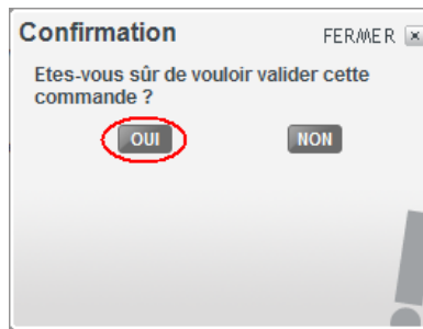
Figure 7 : Confirmation

Etape 8 : Cliquez sur le bouton Oui pour valider votre renouvellement par chèque.