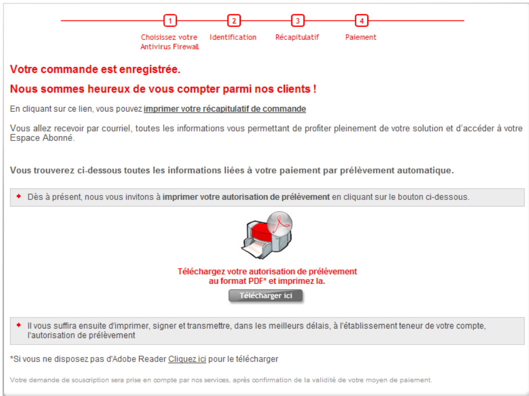
Figure 8 : Commande enregistrée

Etape 9 : Votre renouvellement a bien été enregistré. Vous devez signer et adresser cette autorisation de prélèvement à votre banque. Pour l'ouvrir et l'imprimer, cliquez sur le bouton Télécharger ici .