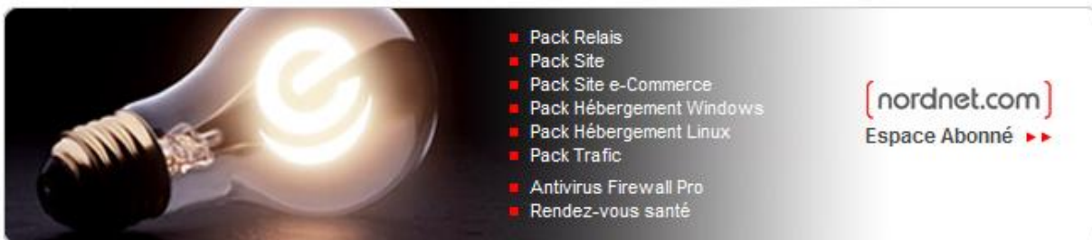
Figure 2 : Espace Abonné NordNet.com

Etape 3 : Ensuite, cliquez sur le lien "Espace Abonné" dans la partie nordnet.com.