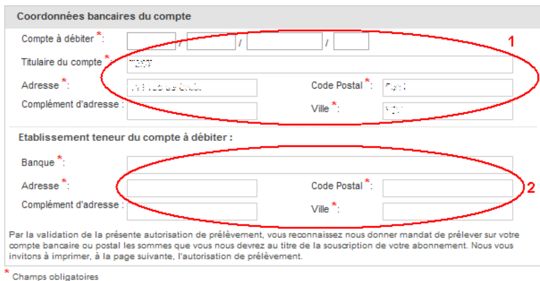
Figure 7 : Coordonnées bancaires

Cliquez ensuite sur le bouton Finaliser votre commande (3) .