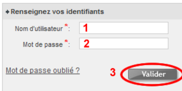
Figure 3 : Identification

Etape 5 : Saisissez votre nom d'utilisateur (1) et votre mot de passe (2). Puis, cliquez sur le bouton Valider (3).