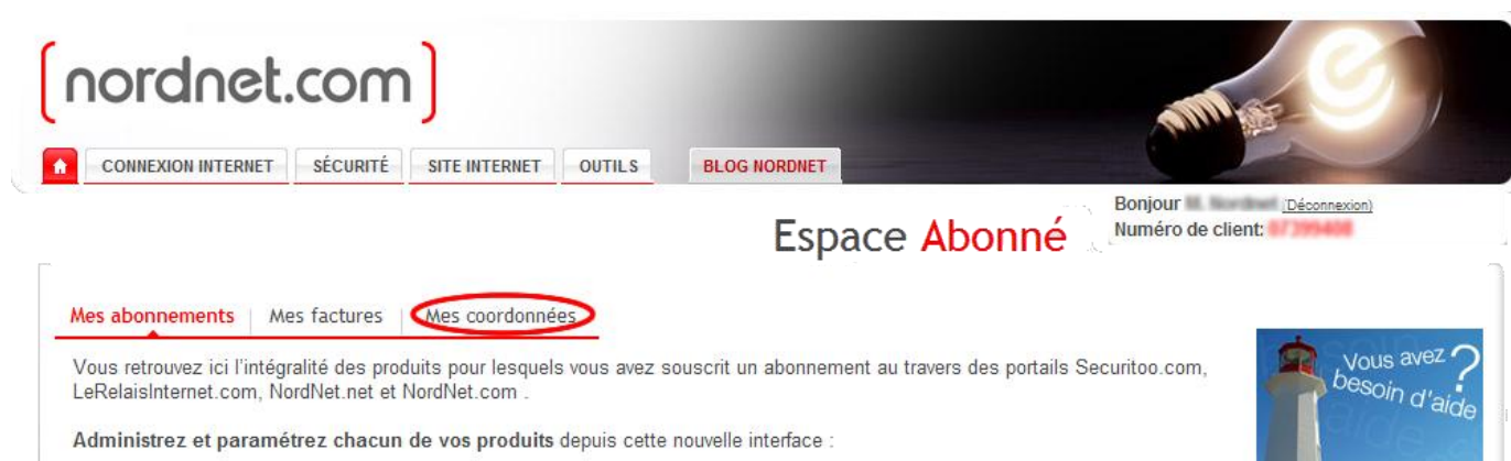
Figure 4 : Mes coordonnées

Etape 6 : Cliquez sur l'onglet "Mes coordonnées".