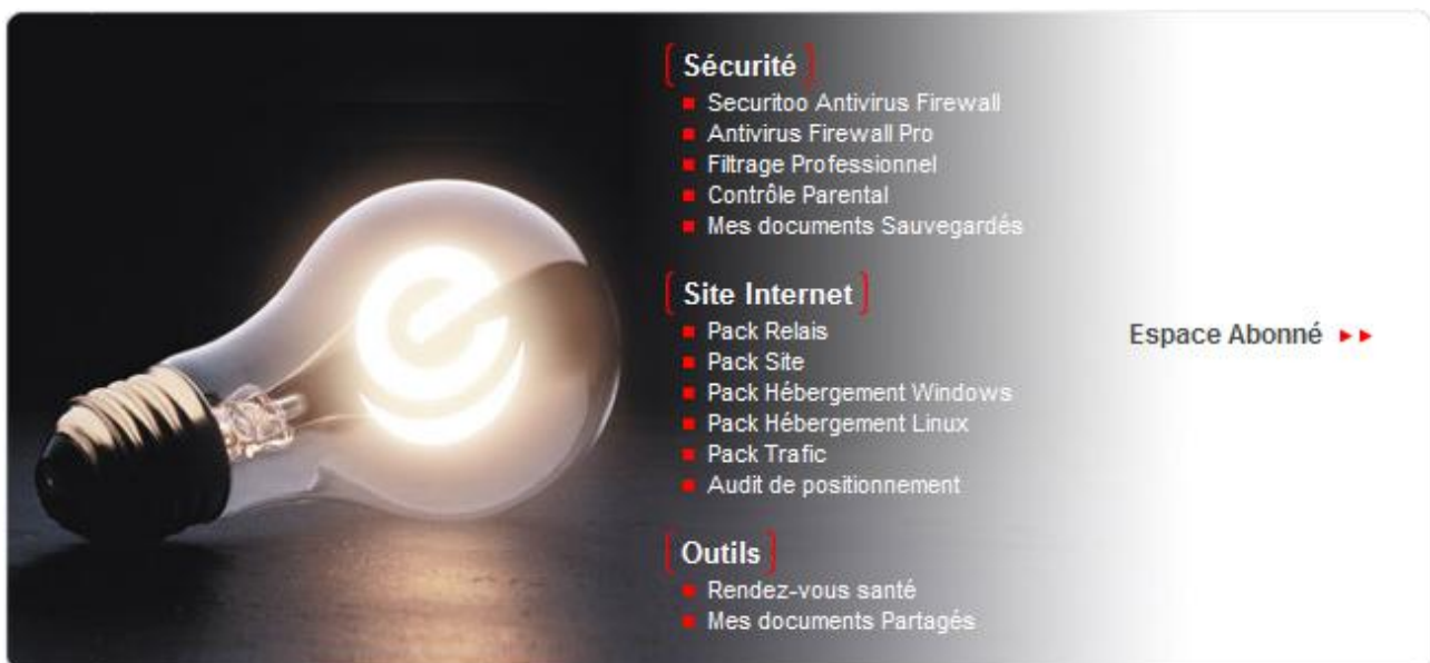
Figure 2 : Espace Abonné NordNet.com

Etape 4 : Ensuite, cliquez sur le lien " Espace Abonné " dans la partie nordnet.com.